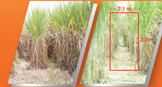
ก่อนใช้ SLR110H สางใบ หลังใช้ SLR110H สางใบ

ชุดเอ็นสางใบมีรัศมีการทำงานกว้าง ถึง 2.1 เมตร และมีระยะสางใบสูงสุด 2.3 เมตร* ซึ่งมากกว่าเครื่องสางใบอ้อยทั่วไปในท้องตลาด ทำให้พื้นที่การทำงานของเกษตรกรกว้างขึ้น ช่วยต่อการเก็บเกี่ยว