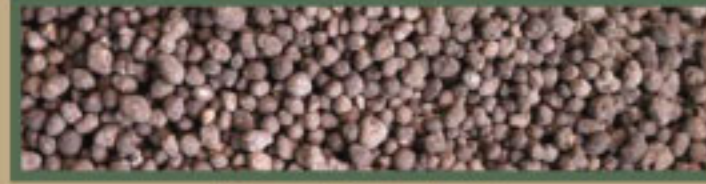
ปุ๋ยอินทรีย์ (ชนิดเม็ดแห้ง)

ชุดปรับเลือกชนิดปุ๋ย สามารถเลือกการหัวานปุ๋ยได้หลายชนิด ได้แก่ ปุ๋ยอินทรีย์ (ชนิดเม็ดแห้ง), ปุ๋ยเคมี (ชนิดเม็ด และชนิดเม็ดทราย) และปุ๋ยชนิดผง (โดโลไมท์)