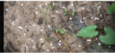
ใช้เครื่องหัวานปุ๋ยคูโบต้า