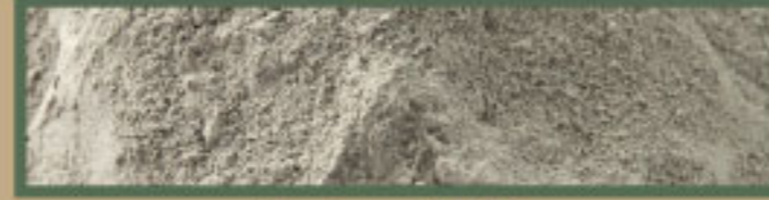
ปุ๋ยชนิดผง (โดโลไมท์)