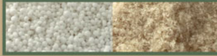
ปุ๋ยเคมี (ชนิดเม็ด และชนิดเม็ดทราย)