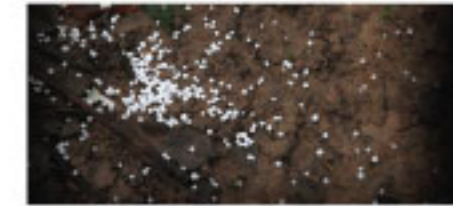
ใช้แรงงานคน